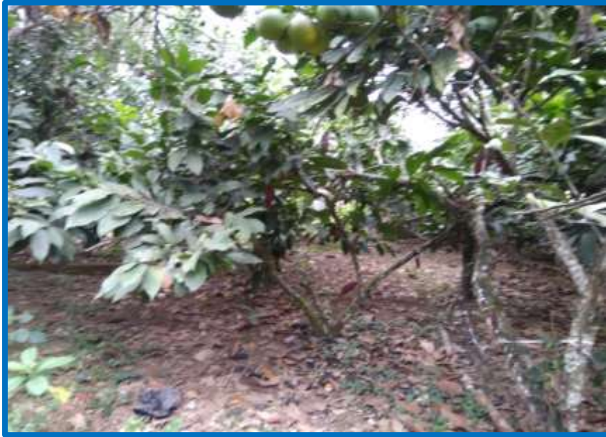
Figura N° 03. Cultivo de Cacao