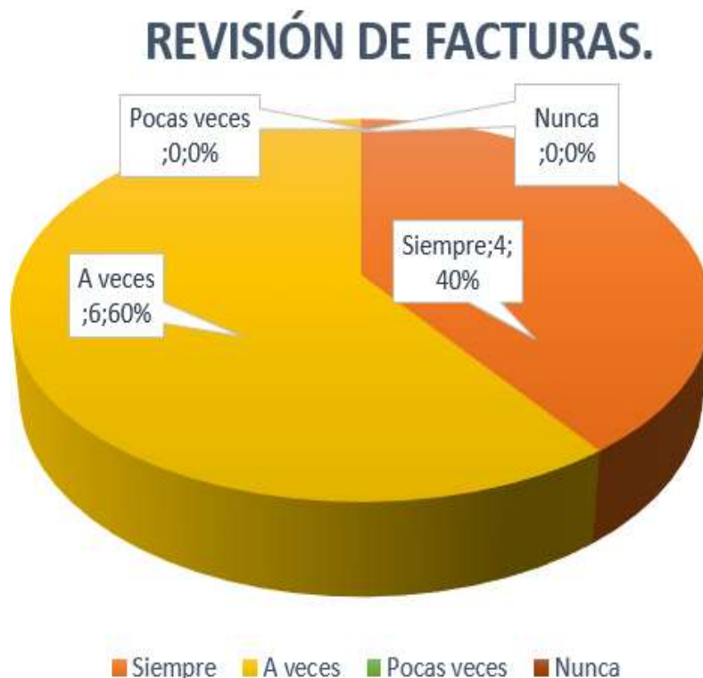
Gráfico 10: Revisión de Facturas.