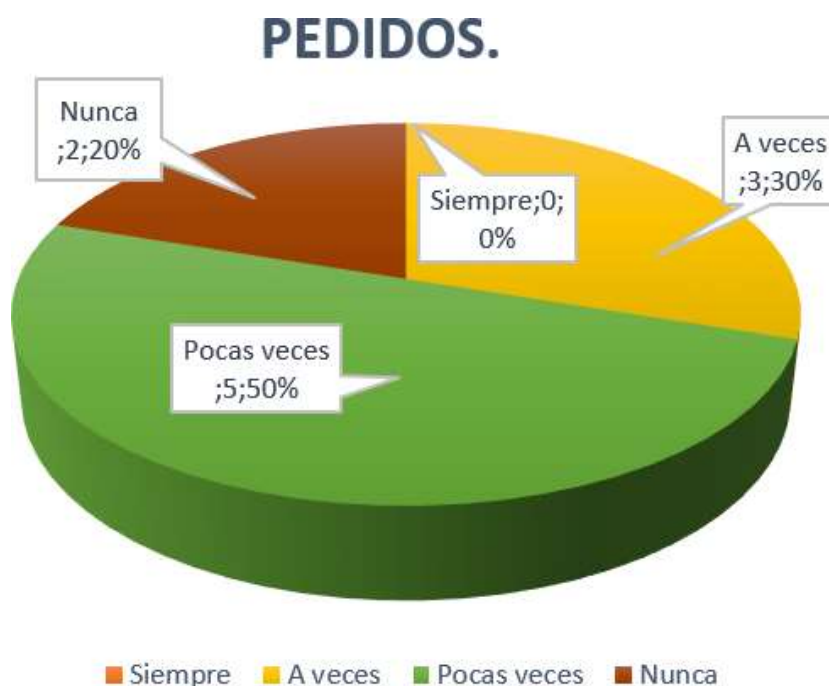
Gráfico 6: Pedidos