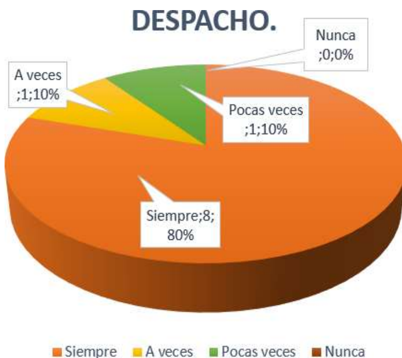
Gráfico 7: Despacho.