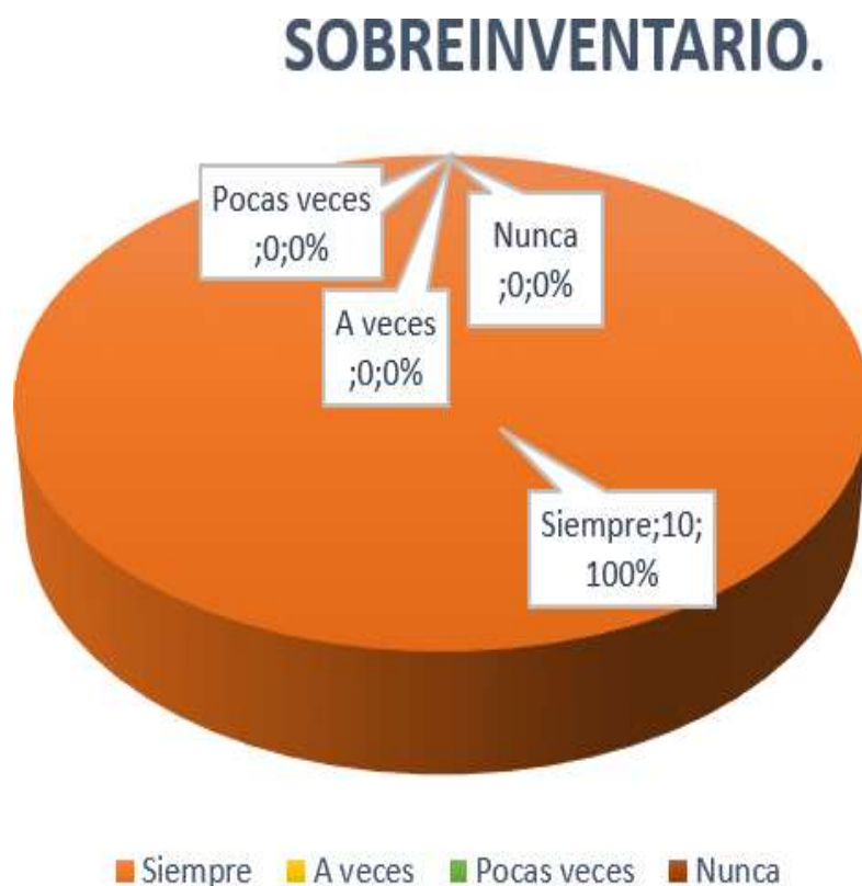
Gráfico 5: Sobreinventario.