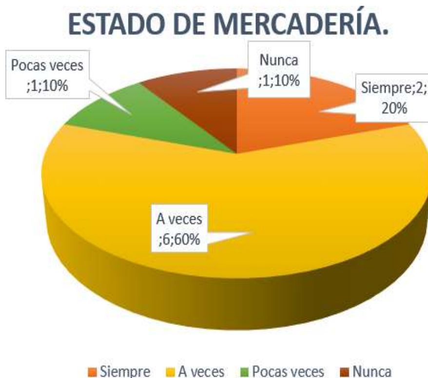
Gráfico 8: Estado de Mercadería.