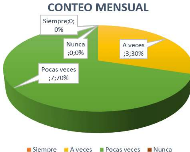
Gráfico 1: Conteo Mensual.