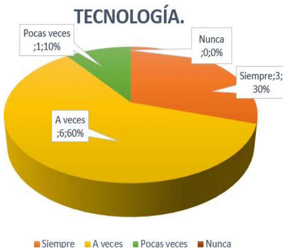
Gráfico 9: Tecnología.