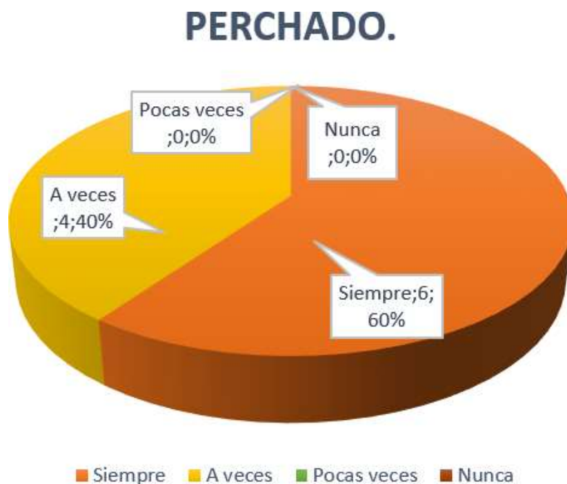
Gráfico 4: Perchado.