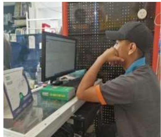
Foto 7 y 8: Supervisión de nuevos procedimientos a empleados.