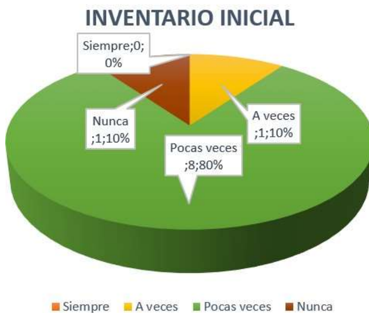
Gráfico 2: Inventario Inicial.