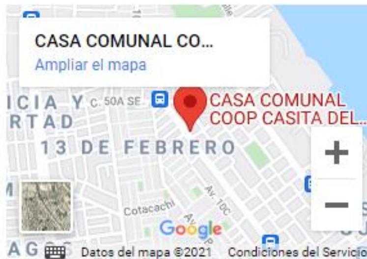
Figura 2 Ubicación en Google Maps de TRANSMACAR S.A.

La empresa TRANSMACAR S.A. inicia sus actividades comerciales y operativas a partir del 10 de septiembre de 1999, se dedica a las actividades de transporte de carga por carretera: troncos, ganado, transporte refrigerado, carga pesada, carga a granel, incluido el transporte en camiones cisterna, traslado de combustible, desperdicios y materiales de desecho, sin recogida ni eliminación. Se encuentra ubicada en la ciudad de Guayaquil, en la Coop. Casitas del Guasmo, Guasmo Norte 8, provincia del Guayas.