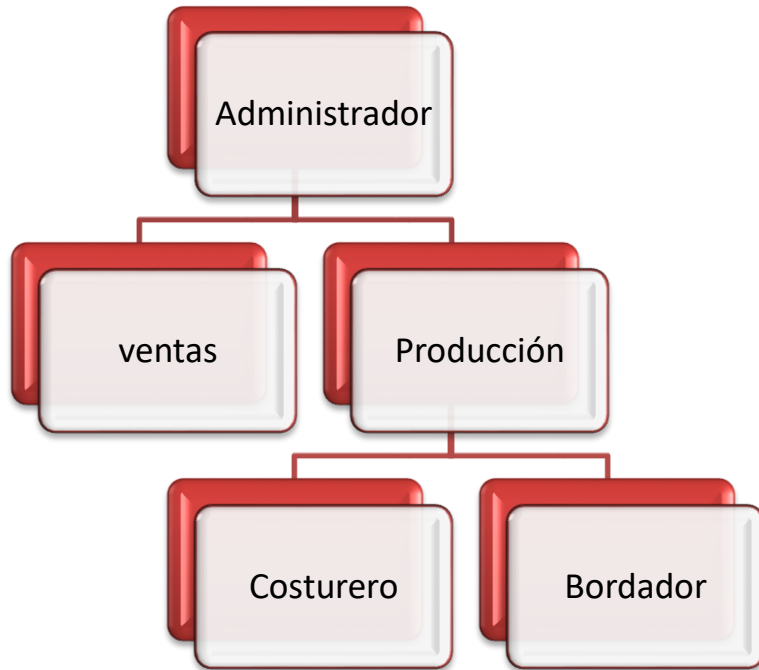
Cuadro 1 Organigrama de la asociación