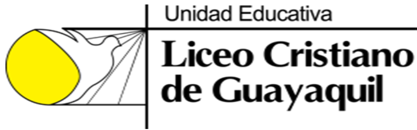
Figura 1. Logotipo de la Unidad Educativa Liceo Cristiano de Guayaquil.