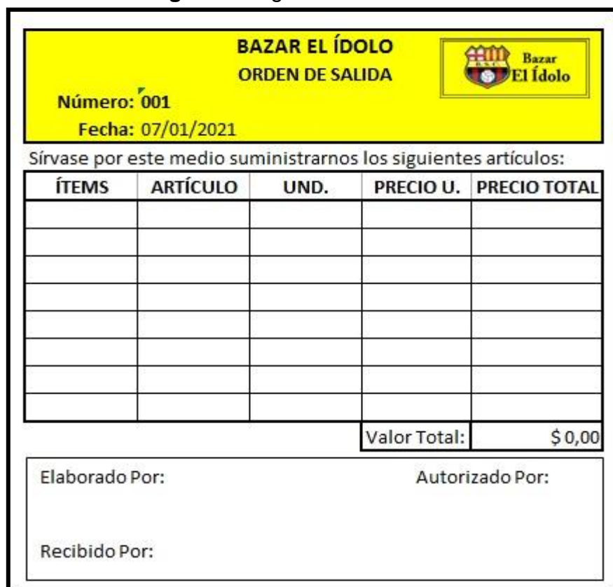
Figura 5: Egreso de mercadería