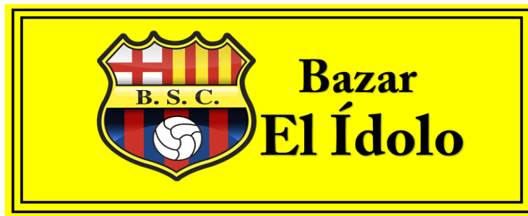
Figura 1: Logo del Bazar