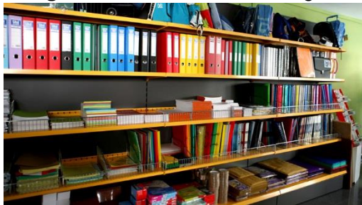
Figura 2: Ilustración de bodega