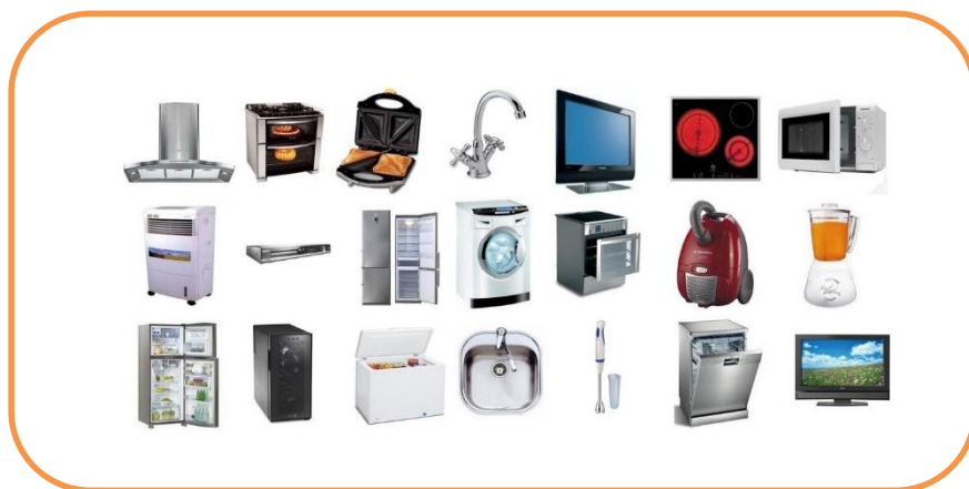
Figura: 3 Productos de almacén Aldahir