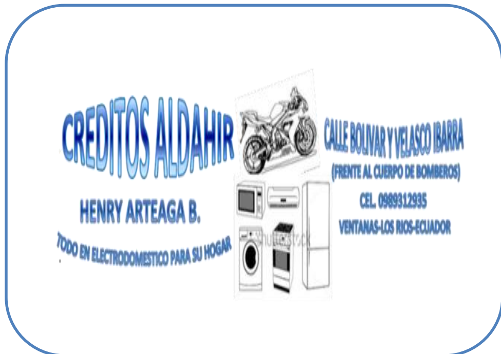
Figura 1: logo de la Empresa