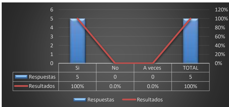
Gráfico 1: Ausencia control de inventario