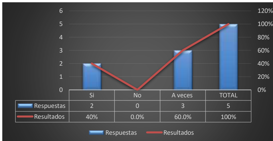
Gráfico 4: Perdidas de clientes