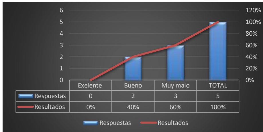
Grafico 3: Control interno del comercial