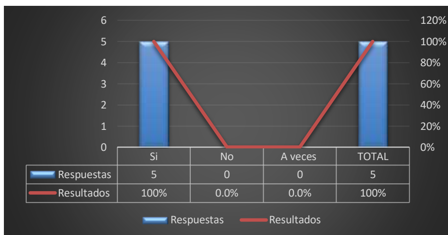
Grafico 6: Misión y visión