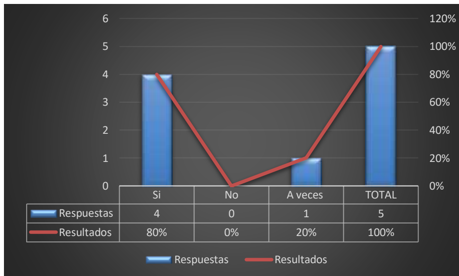
Grafico 2: Dificultades en el ámbito laboral