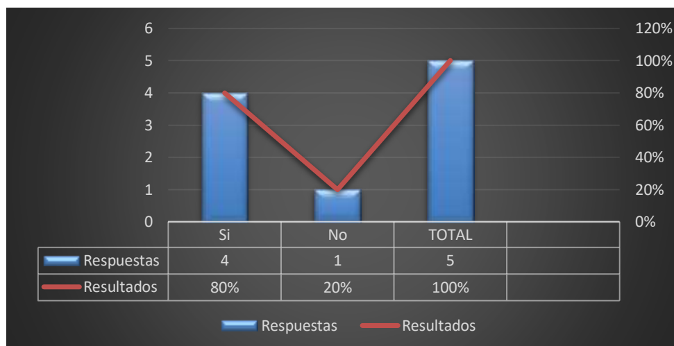
Grafico 10: Contrato de personal