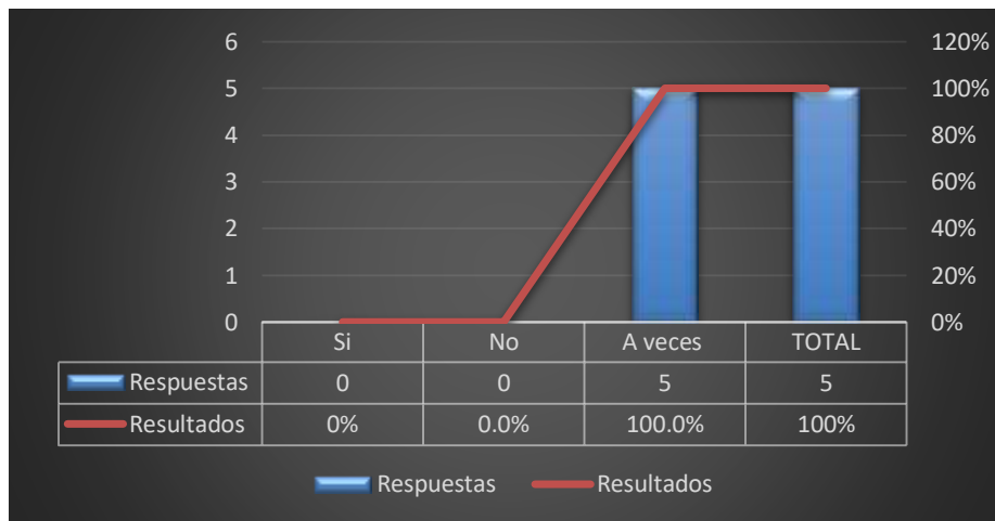
Grafico 9: Beneficios de ley