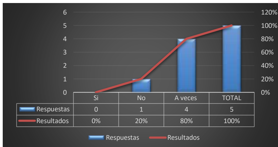
Grafico 8: Equipo e implemento