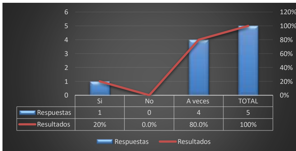
Gráfico 5: Control en los productos