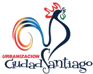
Figura 1 Logo de la urbanización Ciudad Santiago