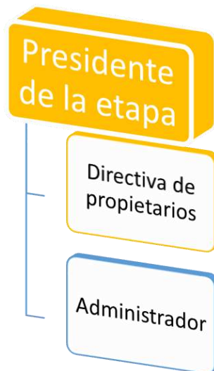
Figura 2 estructura organizacional de la urbanización ciudad Santiago.