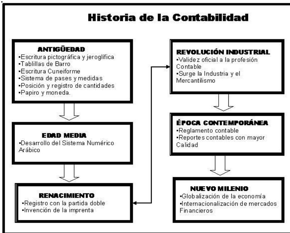
Ilustración 2.1 – Historia de la contabilidad

A continuación en ilustración 2.1 se muestra el origen de la contabilidad como fueron sus inicios desde la antigüedad y como logro situarse ahora en el nuevo milenio.