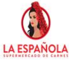
Grafico # 1 Marcas y logos de proveedores