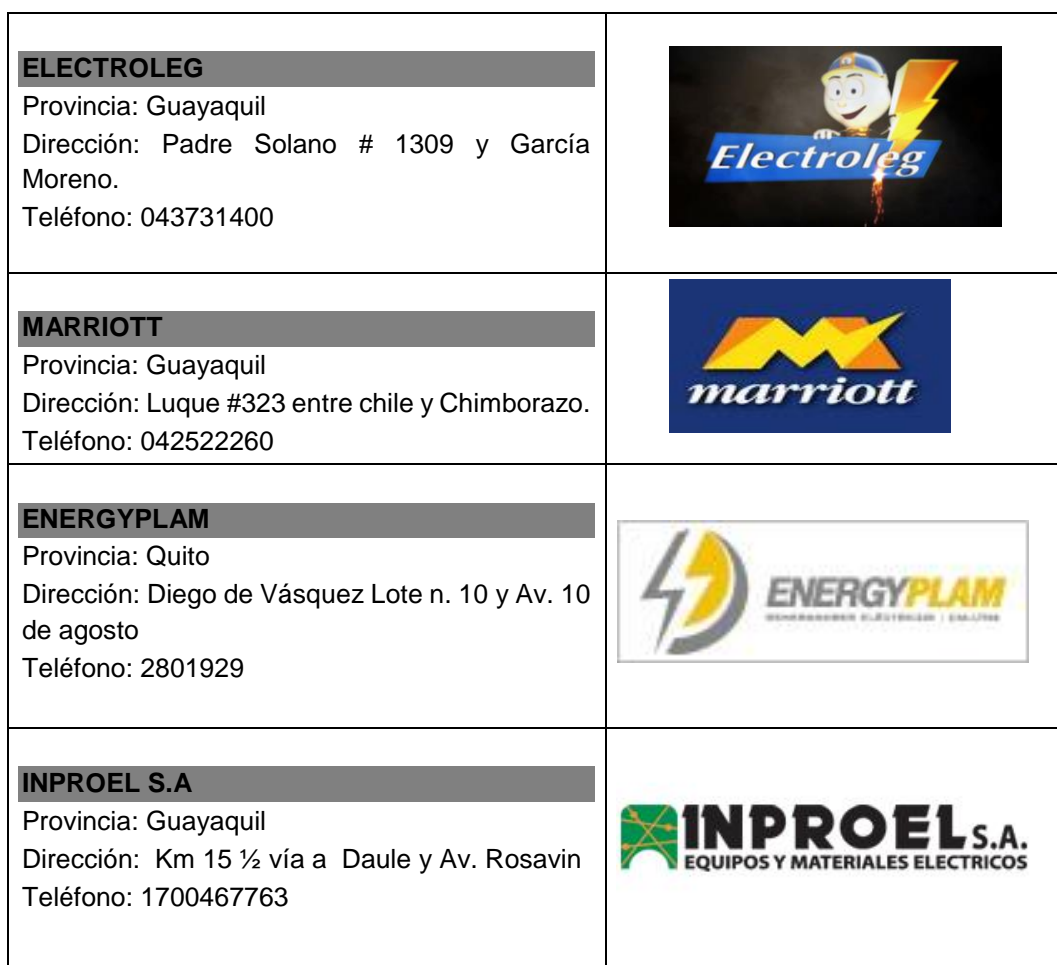
Figura 2 Principales proveedores

Los principales proveedores Iluminaria El Muyuyo se encuentran en Guayaquil, Quito y Ambato.